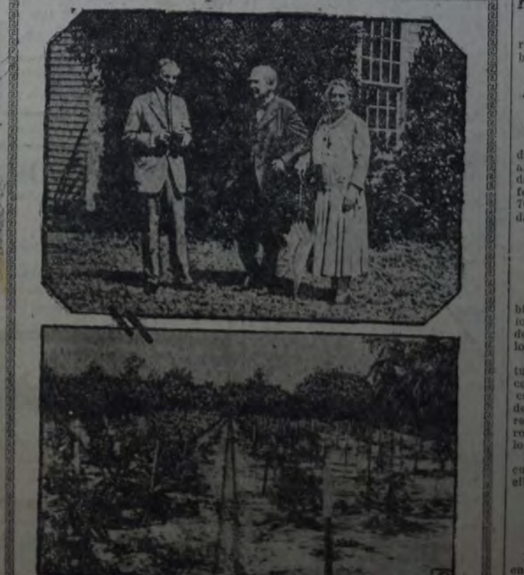
HENRY FORD, FABRICANTE MULTIMILLONARIO DE AUTOMOVILES, compartió un laboratorio, durante el invierno, con Thomas Alva Edison, el Brujo de la Electricidad, quien se ocupa en estudiar las