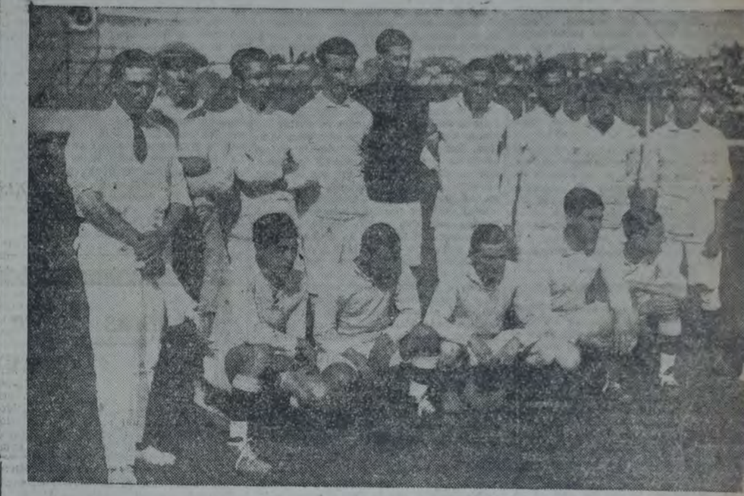
LIGA CORRENTINA, QUE FUE VENCIDA POR EL MINIMO SCORE POR LA LIGA ROSARINA

Como el anterior, por inasistencia del referee y de común acuerdo entre ambos capitanes, se resolvió que actuara de juez el compañero Chiappini. Se inició este partido a las 15.30 horas, en el field Colón 600 (Ramos Mejía), ganando el equipo Juan B. Justo. Inician éstos un avance que no da resultado ninguno. A los 7 minutos, un pase de Biscione lo recoge Diani, el que marca el primer tanto a favor de su cuadro. Dentro de un dominio completo de J. B. Justo, finalizó el primer tiempo con el score de 1 a 0. En el segundo tiempo se acentuó aún más el dominio de J. B. Justo, y a los 7 minutos, de un rebote en el traveseo Morais marcó el segundo tanto para su bando. Se notan peligrosas cargas de J. B. Justo, que juega en excelente forma y con buenas combinaciones. A los 11', de un fuerte rechazo de Diaz, recibe Bleyer; después de esquivar a dos adversarios, dirige un potente y rasante tiro cruzado que deja sin chances al arquero, marcando el tercer tanto para su bando. A los 22' J. S. Villa Devoto consigue marcar su único tanto a favor con un tiro débil a raíz de un peloteo frente a la valla de J. B. Justo. Puesta en juego de nuevo la pelota, llevan varias cargas hacia la valla de Villa Devoto, y a los 28 minutos, de un centro de Bleyer que recoge Diani, éste marca el cuarto goal con un fuerte tiro. A los 34' la línea delantera de J. B. Justo lleva una peligrosa carga a base de combinaciones, y de un pase de Florentino que recibe Diani, éste señala