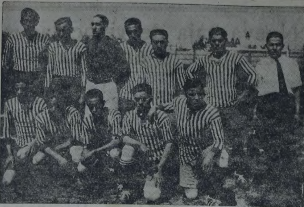
LOS COMPONENTES DE LA FEDERACION CATAMARQUEÑA QUE FUE RON VENCIDO POR LOS CHAQUEÑOS