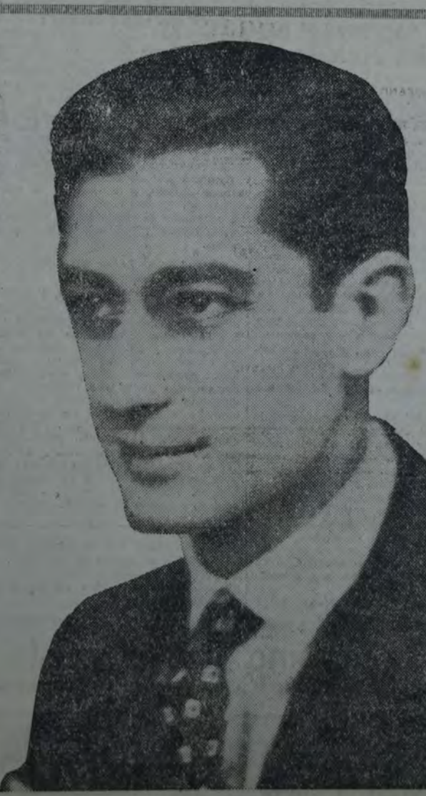
JOVEN PIANISTA ARGENTINO QUE MAÑANA DEBUTARA EN EL TEATRO ODEON