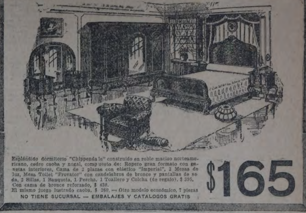
Espléndido dormitorio "Chippendale" construido en roble macizo norteamericano, cetro caoba y nogal, compuesto de: Ropero gran formato con gavetas interiores, Cama de 2 plazas con elástico "Imperial", 2 Mesas de Jaz, Mesa Toilet "Provator" con candelabros de bronce y pantallas de seda, 2 Sillas, 1 Banqueta, 1 Percha, 1 Toallero y Colcha (de regalo), $ 395.